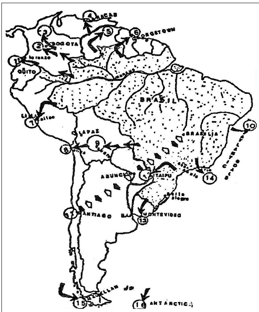
Mapa 1 – Visão Argentina dos Objetivos Geopolíticos Brasileiros.

Esta política de atração do governo boliviano em direção ao Brasil, além de expor o caráter participativo regional do Ministério das Relações Exteriores no Brasil, também exterioriza a necessidade de o governo brasileiro contrapor as posições argentinas na região sul-americana. A Argentina, país de proporções territoriais e econômicas concorrentes ao Brasil no continente, também buscava certa proeminência regional e procurava conter os objetivos geopolíticos do governo brasileiro.